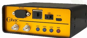
Chronosphere-L6S 498,000 円 から