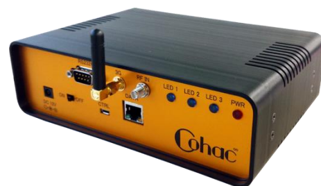
みちびき対応センチメートル精度測位受信機